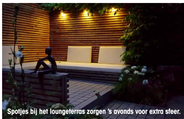
Spotjes bij het loungeterras zorgen 's avonds voor extra sfeer.