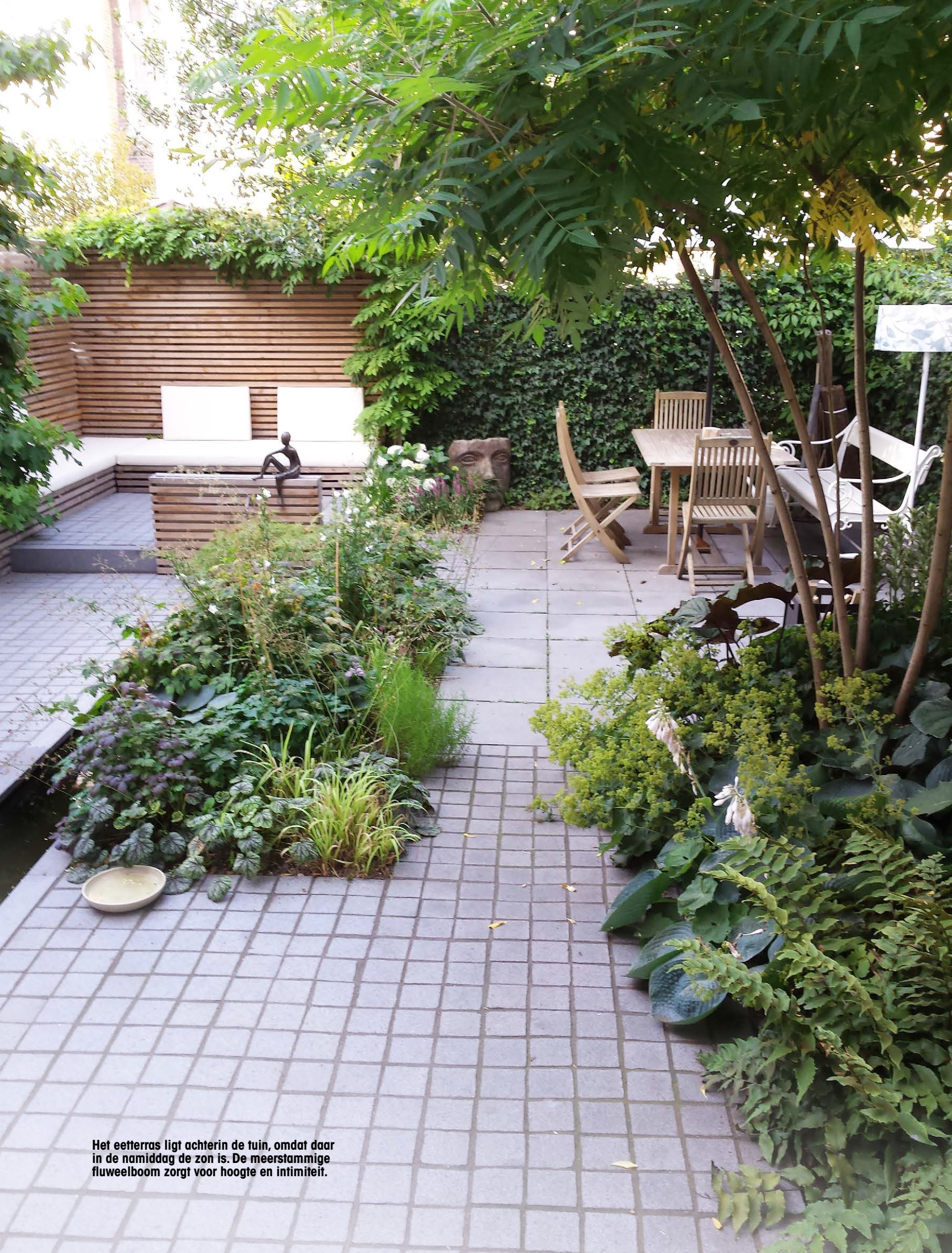
Het eeterras ligt achterin de tuin, omdat daar in de namiddag de zon is. De meerstammige fluweelboom zorgt voor hoogte en intimiteit.