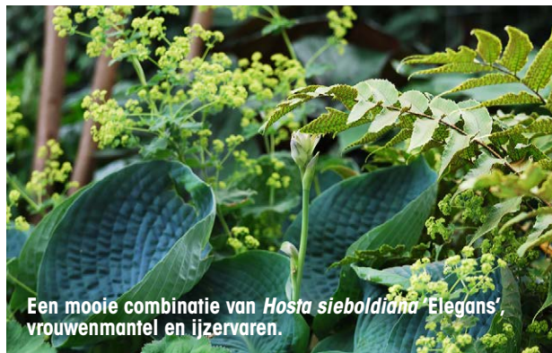
Een mooie combinatie van Hosta sieboldiana 'Elegans', vrouwenmantel en ijzervaren.